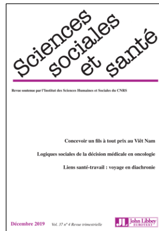
Sciences sociales & santé Trimestriel