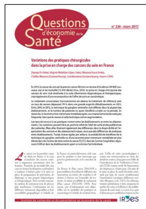
Questions d'économie de la santé Mensuel