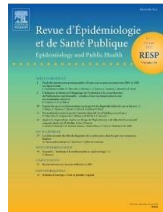
Revue d'épidémiologie et de santé publique Bimestriel