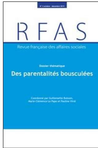
Revue française des affaires sociales Trimestriel