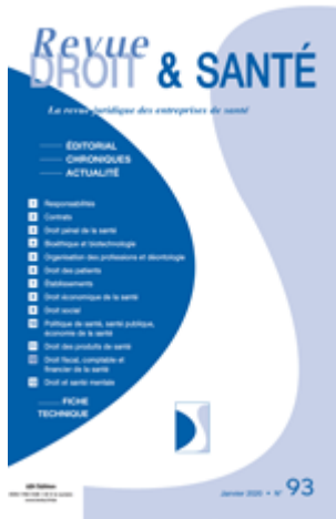
Revue Droit & santé Bimestriel