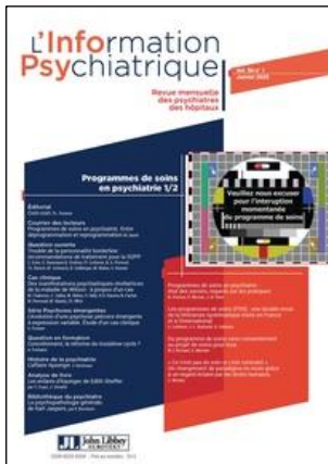
L'Information psychiatrique Mensuel