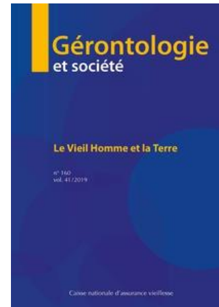
Gérontologie & Société Trimestriel