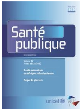
Santé publique Bimestriel