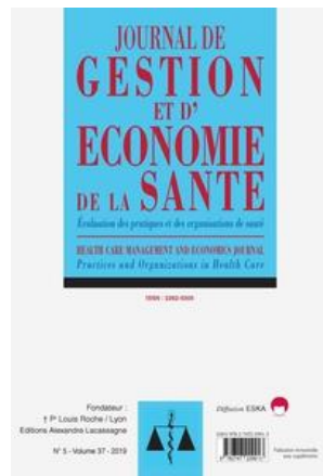
Journal de gestion et d'économie de la santé Bimestriel