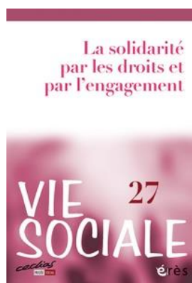
Vie sociale Trimestriel