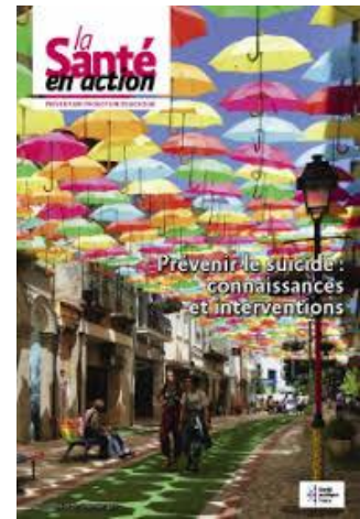
La santé en action Trimestriel