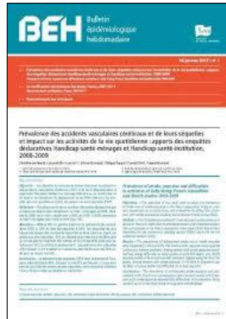
Bulletin épidémiologique hebdomadaire - BEH Hebdomadaire